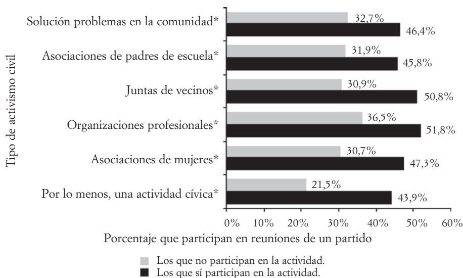
GRÁFICO III. PARTICIPACIÓN EN REUNIONES DE PARTIDOS POLÍTICOS POR PARTICIPACIÓN EN VARIAS ACTIVIDADES DE LA SOCIEDAD CIVIL, 2010

* Diferencias significativas entre los que participan y los que no participan.