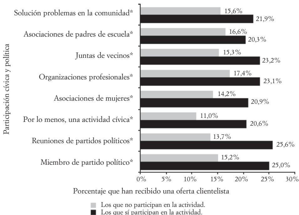
GRÁFICO IV. DISTRIBUCIÓN DE LAS OFERTAS CLIENTELISTAS POR PARTICIPACIÓN CÍVICA Y POLÍTICA, 2010

* Diferencias significativas entre los que participan y los que no participan.