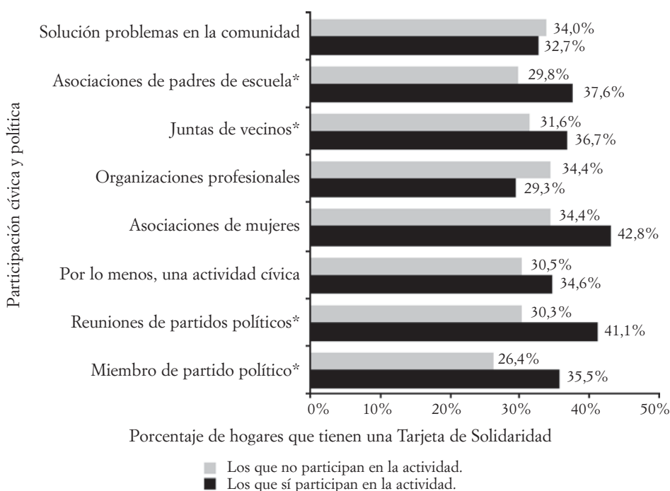
GRÁFICO V. DISTRIBUCIÓN DE LAS TARJETAS DE SOLIDARIDAD POR PARTICIPACIÓN CÍVICA Y POLÍTICA, 2010

* Diferencias significativas entre los que participan y los que no participan.