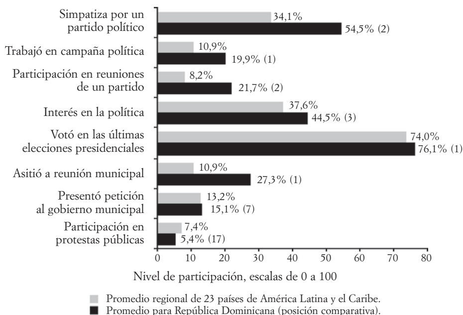
GRÁFICO II. PARTICIPACIÓN POLÍTICA EN REPÚBLICA DOMINICANA Y OTROS PAÍSES DE AMÉRICA LATINA Y EL CARIBE, 2010